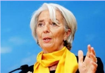
رئیس صندوق بین المللی پول: