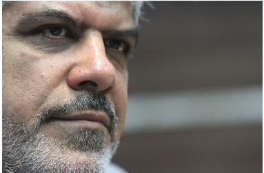
رئیس کمیسیون کشاورزی مجلس: