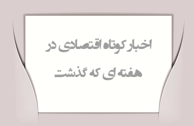
نوبخت خیر داد

به گزارش تسنیم به نقل از ریانسوستی، ولادیمیر چیژوف نماینده روسیه در اتحادیه اروپا روز گذشته تصریح کرد که اروپا وابستگی بیشتری به عرضه گاز طبیعی روسیه نسبت به نفت دارد. بر خلاف گاز طبیعی، نفت خام به صورت آزادانه در بازارهای بین المللی به فروش می رسد ولی هیچ جایگزینی برای گاز طبیعی روسیه نه امروز و نه در آینده نزدیک وجود دارد .