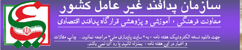
سازمان پدافند غیر عامل کشور