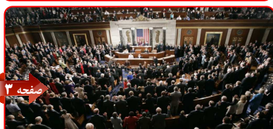
راه‌حل دیپلماتیک و مسئله هسته‌ای ایران