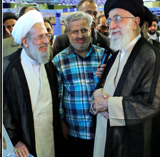
امام خامنه ای در بازدید از تولیدات علمی و پژوهشی مؤسسه دارالحديث:

شماره ششم - سال اول - شنبه ۲۴ خرداد ۱۳۹۲ - ۱۶ شعبان ۱۳۳۵ - 14 june 2014 - گستره توزیع سازمان پدافند غیر عامل کشور