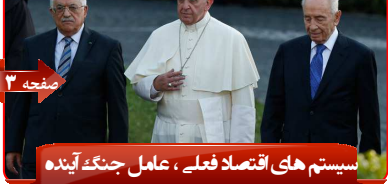
سیستم های اقتصاد فعلی ، عامل جنگ آینده

شماره ششم - سال اول - شنبه ۲۴ خرداد ۱۳۹۲ - ۱۶ شعبان ۱۳۳۵ - 14 june 2014 - گستره توزیع سازمان پدافند غیر عامل کشور