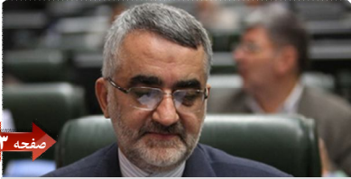
جنگ اقتصادی بی رحمانه لایحه دارد