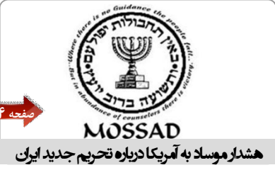
هشدار موساد به آمریکا درباره تحریم جدید ایران

مستود کردن دارایی های بانک مرکزی ایران باید لغو شود . در ژانویه ۲۰۱۲ (بهمن ۱۳۹۰) اتحادیه اروپا تصمیم گرفت که به واسطه نگرانی از ابعاد نظامی احتمالی برنامه هسته ای ایران خرید نفت از ایران را قطع کند و بانک مرکزی ایران را مورد تحریم قرار دهد. به دنبال تحریم بانک مرکزی ایران دارایی های این بانک نیز در اروپا مسدود شد.تحریم های اتحادیه اروپا به دنبال رشته ای از قطعنامه های شورای امنیت سازمان ملل وضع شد که محدودیت هایی را علیه تعدادی از نهادها و اتباع ایران اعمال می کردند.شورای اروپا در آن مقطع اعلام کرد که یکی از دلایل تحریم بانک مرکزی ایران این نهاد مالی به دورزدن تحریم های بین المللی علیه ایران بوده است.دادگاه اتحادیه اروپا می گوید شورای اروپا برای این ادعای خود هیچ دلیل و مدرکی ارائه نکرده، به هیچ نقل و انتقال مشخصی اشاره نکرده و از این رو این تصمیم باید لغو شود.کمی بعد از اجرای مژدن تصمیم اروپا برای تحریم بانک مرکزی ایران، اتحادیه جهانی