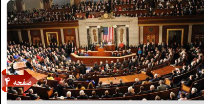
خیز دور بعدی سنا برای افزایش تحریم‌ها از دیماه