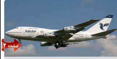
شرکت‌های آمریکایی حق معامله با ایران را ندارند