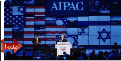
تلاش آیکه برای تحریم تازه علیه ایران

اعلام کرد که بودجه سال آینده را بر مبنای نفت ۷۰ دلاری تنظیم کرده و به مجلس ارائه خواهد داد.سرمقاله نویس وال استریت ژورنال نوشته که مقامات اروپایی و آمریکایی اعتقاد دارند که کاهش قیمت نفت می تواند فشار بر مذاکره‌کنندگان ایرانی را در ۷ ماه آینده (ضرب‌الاجل بعدی توافق هسته‌ای) بالا برده و آنها را به دادن امتیاز مجبور کند؛ امتیازاتی که ایرانیان در دورهای پیشین مذاکره به طرف اروپایی نمی‌دادند.یکی از دلایل اصلی کاهش شدید قیمت نفت، افزایش تولید و مخالفت عربستان با کاهش نفت تریقی به بازارهای بین المللی است.مقامات عربستان که خود در مقاله‌ای به تحلیل تأثیر کاهش شدید قیمت نفت بر جهت گیری های سیاسی دولتمردان ایران پرداخت و مدعی شد که این امر به امتیازدهی مذاکره‌کنندگان هسته ای ایران در برابر +۵۱ خواهد انجامید.قیمت سید نفتی اوپک امروز چهارشنبه به ۶۶ دلار رسید و این در حالی است که قانون بودجه امسال، با نفت ۱۰۰ دلاری از تصویب نمایندگان مجلس ایران گذشت.وال استریت ژورنال نوشته که «انتظار نمی رود قیمت نفت در آینده نزدیک، روند افزایشی درپیش بگیرد که این امر می تواند اثری فلج کننده بر بودجه دولت ایران داشته باشد، بودجه‌ای که ۶۰ درصد از منابع مالی خود را از صادرات نفت تأمین می کند.»دولت ایران چند روز پیش